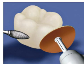
3. Finirozza és polírozza!

A Protemp™ Crown egy színárnyalatban és széles formaválasztékkal rendelkezik. Az elkészítéshez egyszerűen válassza ki a megfelelő méretet és adaptálja a környezetéhez! Világítsa meg, polírozza majd ideiglenes ragasztóval (RelyX™ Temp NE) rögzítse!