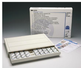
Protemp Crown Bevezető Készlet