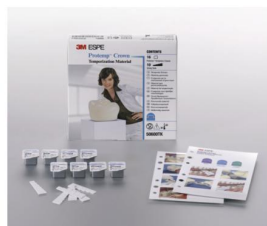
Protemp Crown Próbakészlet