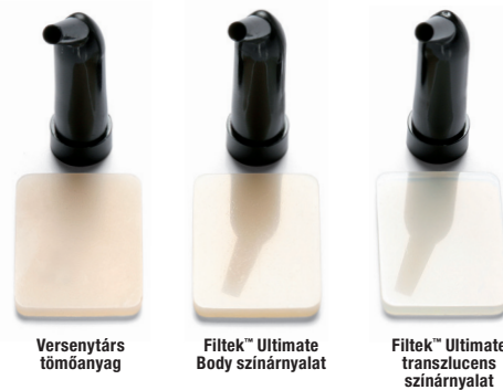
Tartós polírozás. Az egymás melletti kép tükrözi a Filtek Ultimate anyagok hosszabban tartó polírozottságát egy vezető márkával szemben, 6000 fogmosási ciklus után.