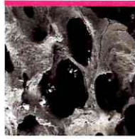
Durva felület, nagy pórusok, és a nagy porozitás fokozza a csontok beágyazódását.

A durva felszínű, emberhez hasonló sertés csont részecskék megkönnyítik az új sejtek rögzülését. 1,2